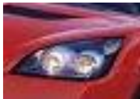
Opel Lotus Speedster