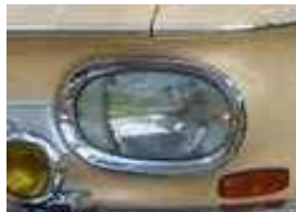
NSU Prinz 1000