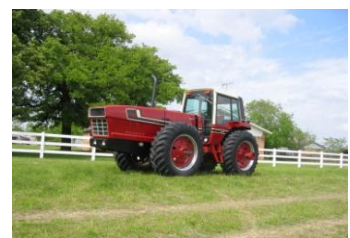
IH / International Harvester