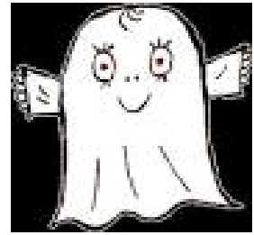
Lilla Spöket Laban