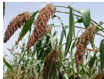
Sorghum / Durra