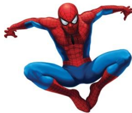
Spindelmannen / Spider man