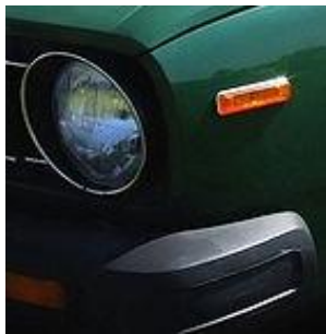
Volvo / Daf 66