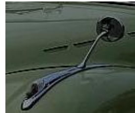
BMW 501 / 502